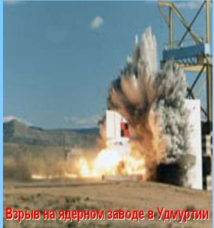
Взрыв на ядерном заводе в Удмуртии